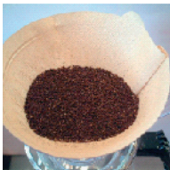
コーヒーを平らにするとお湯が均等にかかる

自分で淹れるコーヒーは、濃いめにしたり薄めにしたりなど、自分好みの味に調整できるので自分に合ったコーヒーが味わえます。