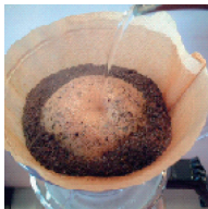
中心から円を書くように静かに注ぐ。